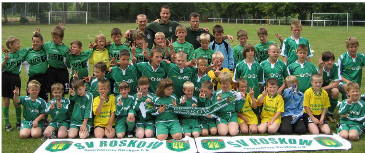
C-Junioren Jahrgang 1995/96